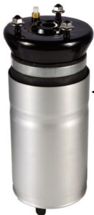
5. 1x Módulo de bolsa de ar